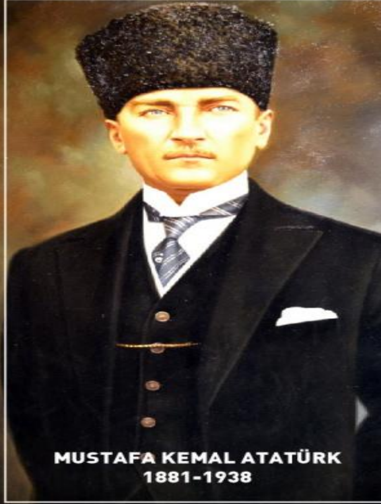
MUSTAFA KEMAL ATATÜRK 1881-1938